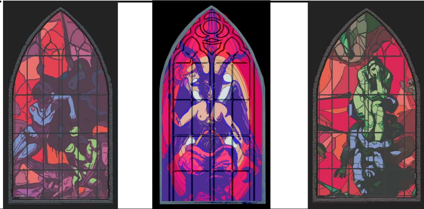
Backdrop Rechts 3 x 1,5 m